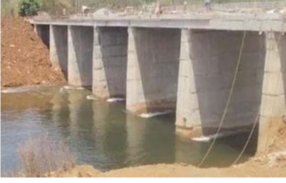
चुडामनी नदीत सोडण्याची चुडामनी नदीच्या उगमस्थ मागणी नागरिकांची आहे. नाजवळ नागठाणा १ व

वरुड - पाणीटंचाईचा दाह कमी करण्यासाठी नागठाणा धरणाचे पाणी चुडामनी नदीत सोडल्या जाते. यामुळे नदीकाठच्या विहिरी व पाणी पुरवठ्याचे स्रोत पुनर्जिवित होतात. यावर्षी पाणी सोडण्यास विलंब झाल्यामुळे पाणीटंचाईचा दाह वाढला आहे. यामुळे धरणाचे पाणी