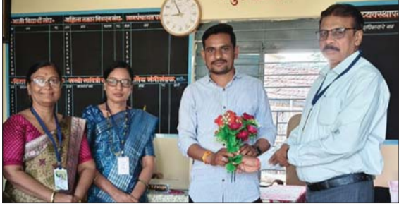
देणगी दिली. त्यांच्या या सहकार्यामुळे शाळेचे