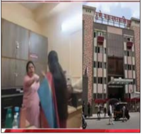
वादाचा हा व्हिडिओ

पुणे - पुण्यातील वसतिगृहाच्या कामावरून भाजपच्या आजी-माजी नगरसेविकांमध्ये तुफान खडाजंगी झाल्याची माहिती समोर आली आहे. दोन गटातील