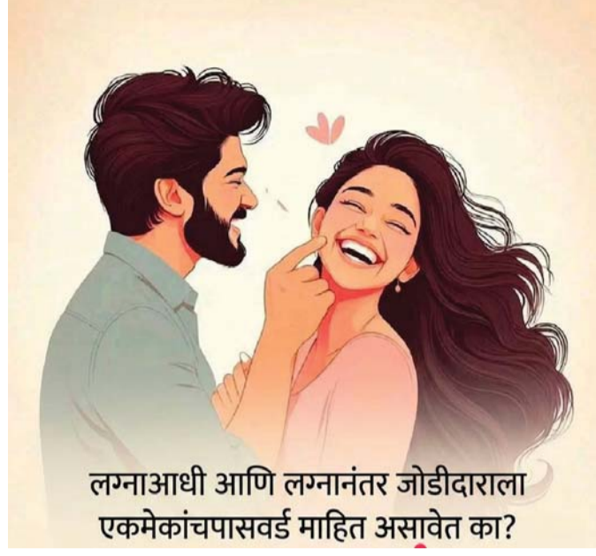
लग्नाआधी आणि लग्नानंतर जोडीदाराला एकमेकांचा पासवर्ड माहित असावेत का?

२. फक्त जोडीदाराला प्रश्न नसतो: जेव्हा तुम्ही तुमचा सोशल मीडिया